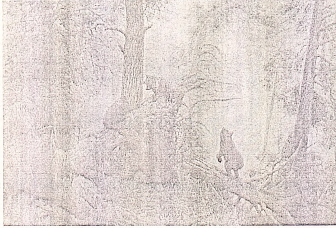
«Утро в сосновом лесу»