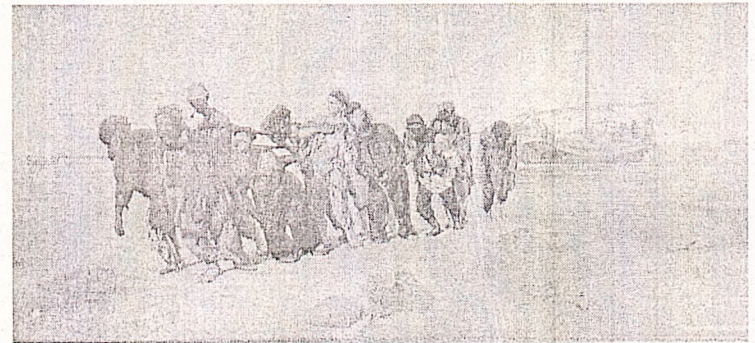
«Бурлаки на Волге»