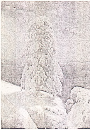
«На севере диком»